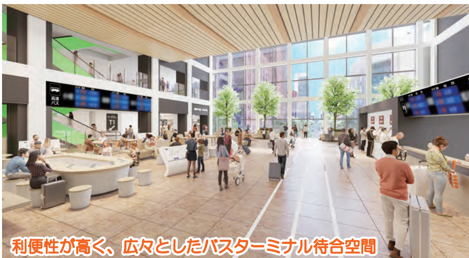
利便性が高く、広々としたバスターミナル待合空間