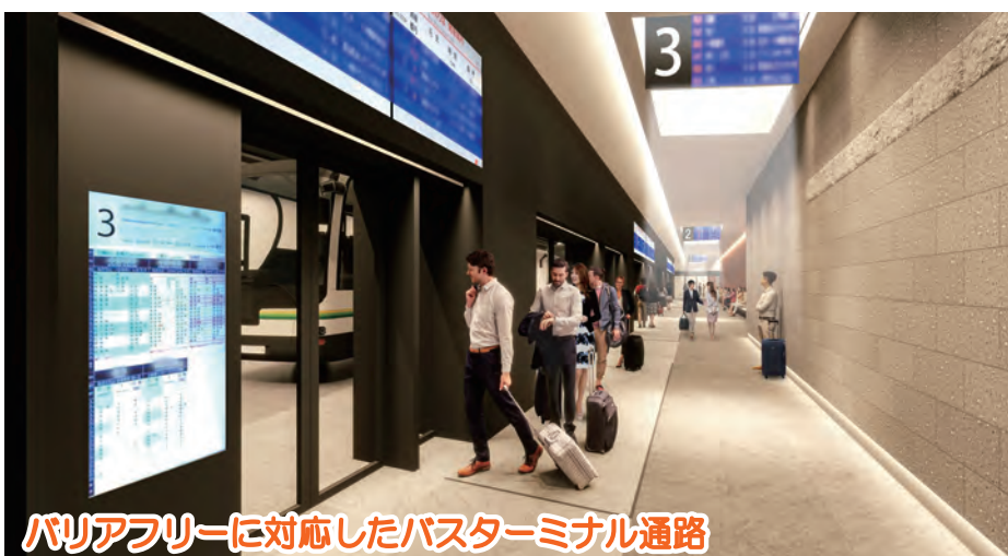
バリアフリーに対応したバスターミナル通路