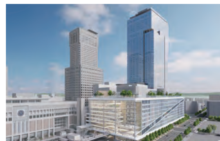
再開発事業完成イメージ

◆北海道新幹線札幌開業、札幌駅周辺の開発を見据え、道都札幌の玄関口にふさわしい空間形成と、高次都市機能・交通結節機能の強化を目指します。