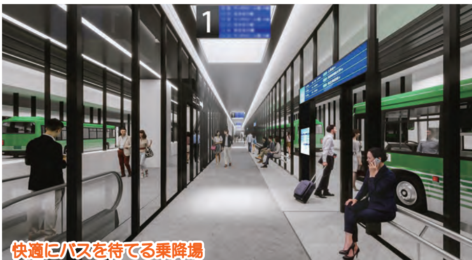
快適にバスを待てる乗降場

※建物外観や形状、内部レイアウト等はイメージであり、実態と異なる場合があります。